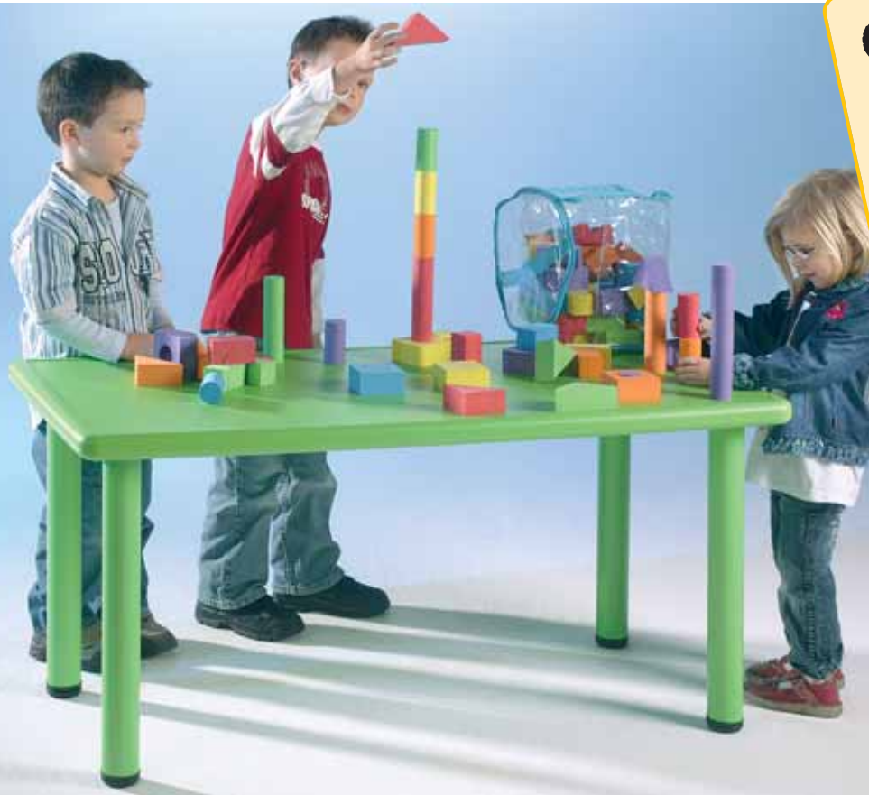
Table rectangulaire en plastique rigide

Combinez ces chaises avec nos tables en plastique rigide! Vous trouverez un grand choix de tables à pd page 469.