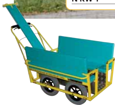
Table au milieu à relever permettant une entrée facile. Rabattue, elle donne plus de sécurité.

Dimensions, L/H/P: 85 x 90 x 145 cm N KW-1